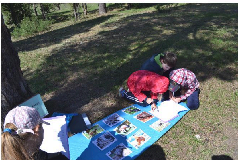
Городской однодневный слет исследовательской природы «Учись жить на земле», выполнение задания «Интеллектуальной площадки»