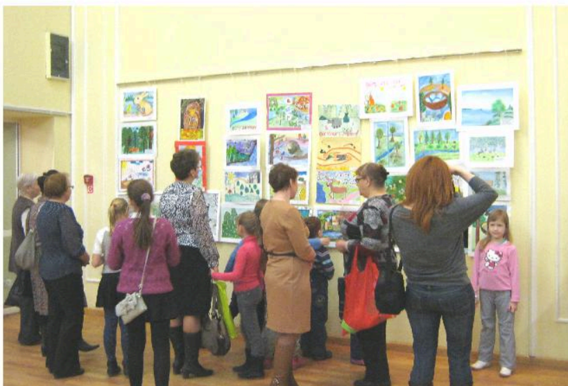
Выставка изобразительных работ городского экологического конкурса «Наш веселый Ералаш»