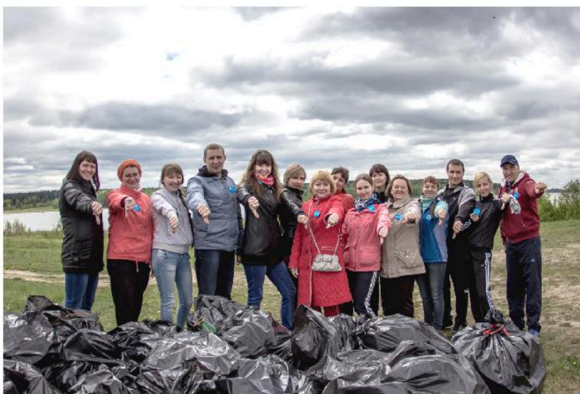
Сотрудники ООО «НПЦ «Березниковский институт экологии и охраны труда» и отдела по охране окружающей среды и природопользованию администрации города на субботнике у Нижне-Зырянского водохранилища