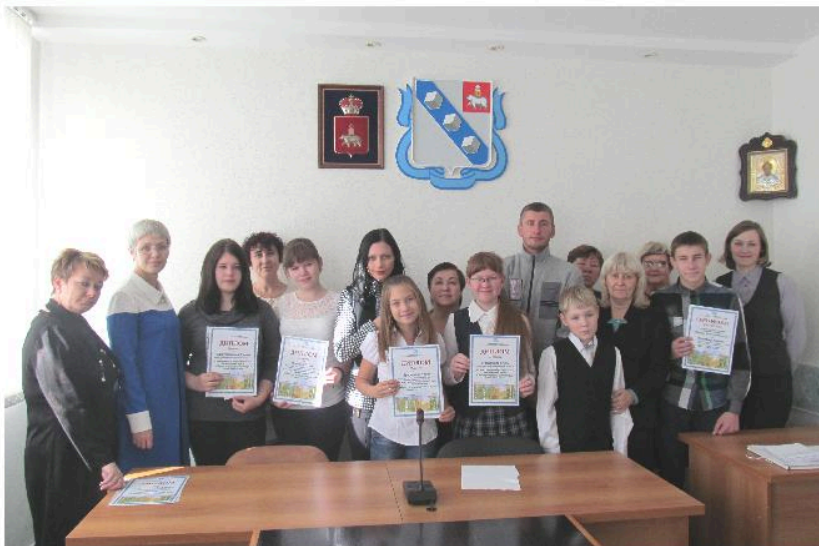
Награждение победителей и призеров городского конкурса авторских стихов для детей школьного возраста «Сбережем природу родного края»