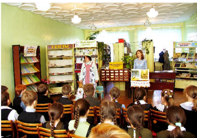
Конкурсное мероприятие Библиотеки № 3 МБУК «ЦБС» «Белоствольный символ России» в рамках Смотр- конкурса работы библиотек по экологическому просвещению населения «Библиотечный ЭкоГрад-2014»