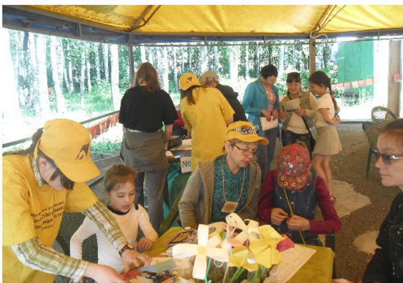
Экоквест «Паутина» в Городском парке культуры и отдыха - мероприятие Библиотеки № 6 МБУК «ЦБС» в рамках Смотра-конкурса работы библиотек по экологическому просвещению населения «Библиотечный ЭкоГрад-2014»