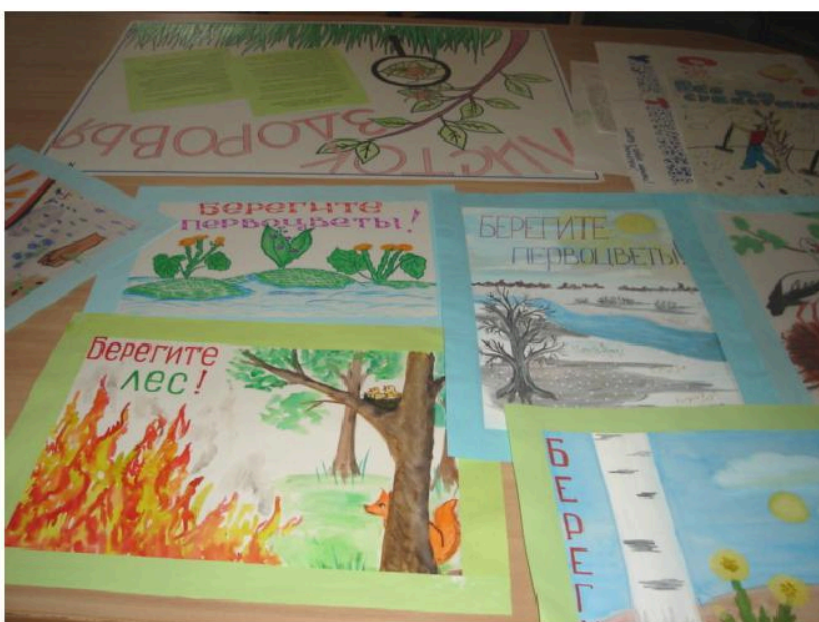
Конкурс плакатов «Берегите лес» в МАОУ «Средняя общеобразовательная школа № 22»