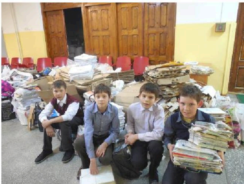
Сбор макулатуры в МАОУ «Средняя общеобразовательная школа № 22» в рамках городской экологической акции- конкурса «Подари жизнь дереву»