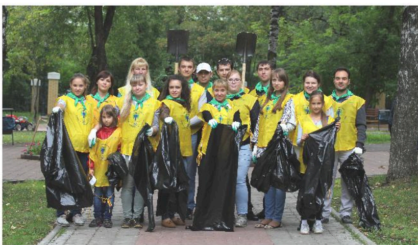
Флешмоб от участников Всероссийского экологического субботника «Зеленая Россия» - Совета активной молодежи «Лига Лидеров» филиала «Азот» ОАО «ОХК «Уралхим» в г. Березники