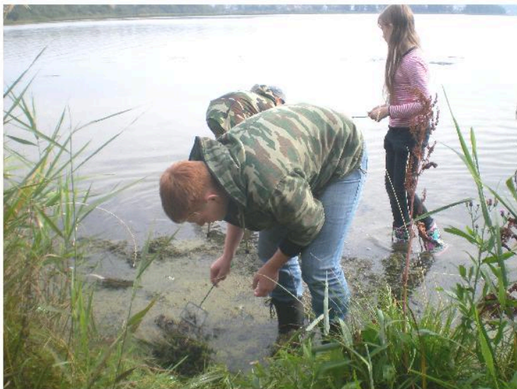
Городской полевой фестиваль «Наследие и дети». Выполнение полевых исследований, поиск зообентоса