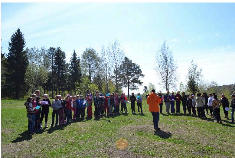
Торжественное построение участников городского однодневного слета исследователей природы «Учись жить на Земле».