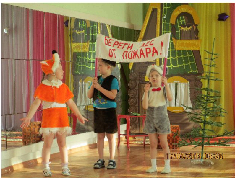
Экологическая сказка «Пожар в лесу», представленная воспитанниками МАДОУ «Детский сад № 89» - призерами городского экологического конкурса «Наш веселый Ералаш»