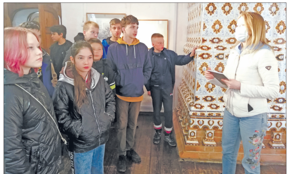
Ученикам из поселка Железнодорожный понравился мюзикл «Золушка» и познавательная экскурсия в Палатах Строгановых