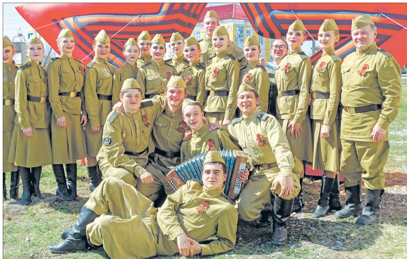
Коллектив Усольского Дома культуры.