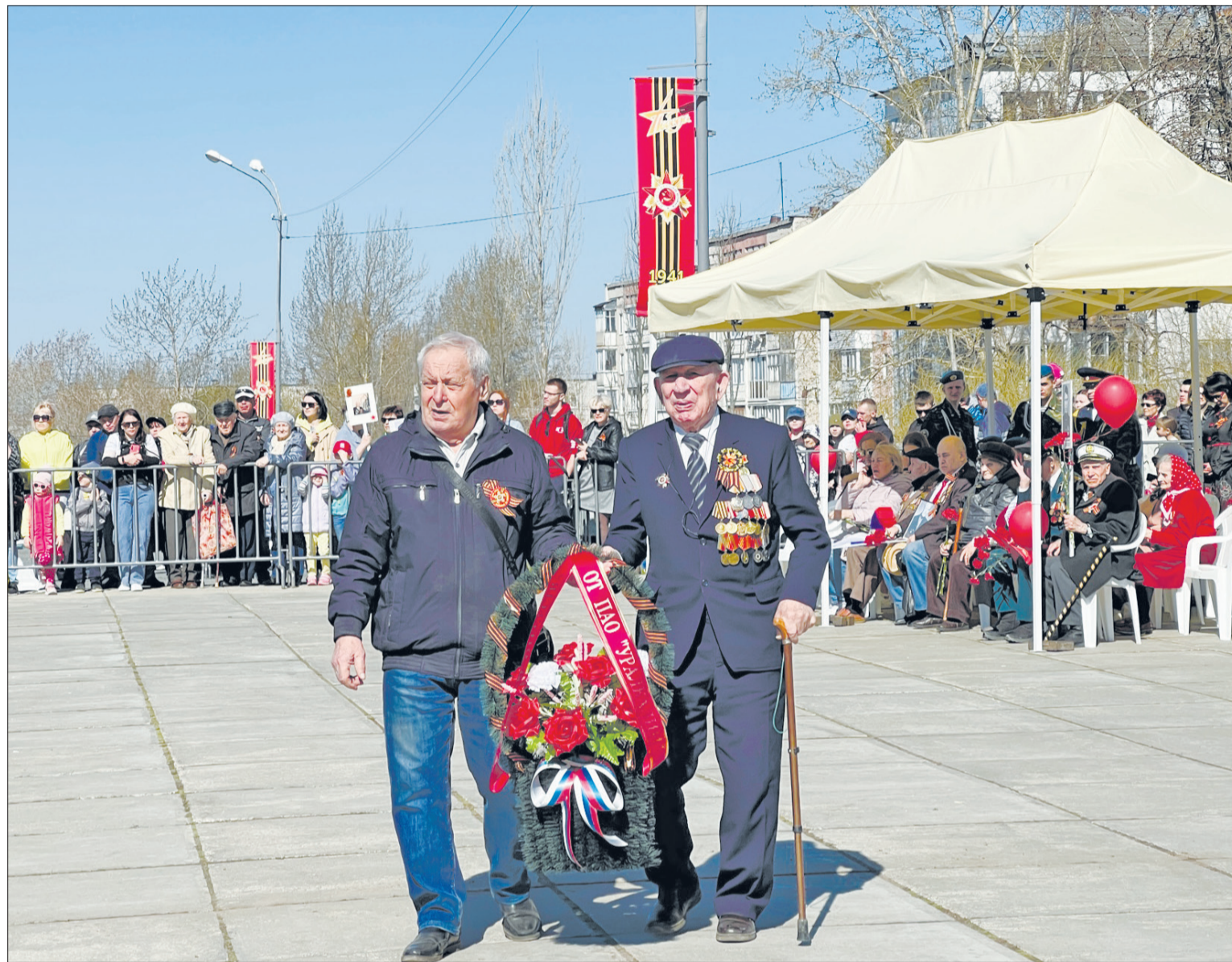
Возложение венков к Мемориалу Победы.