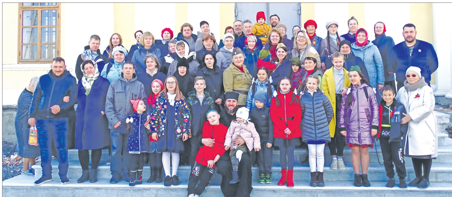
На празднике у памятника победы и воинской доблести (Никольский храм). / ФОТО ПРЕДОСТАВЛЕНО АВТОРОМ

На братском кладбище в Усолье. / ФОТО ПРЕДОСТАВЛЕНО АВТОРОМ