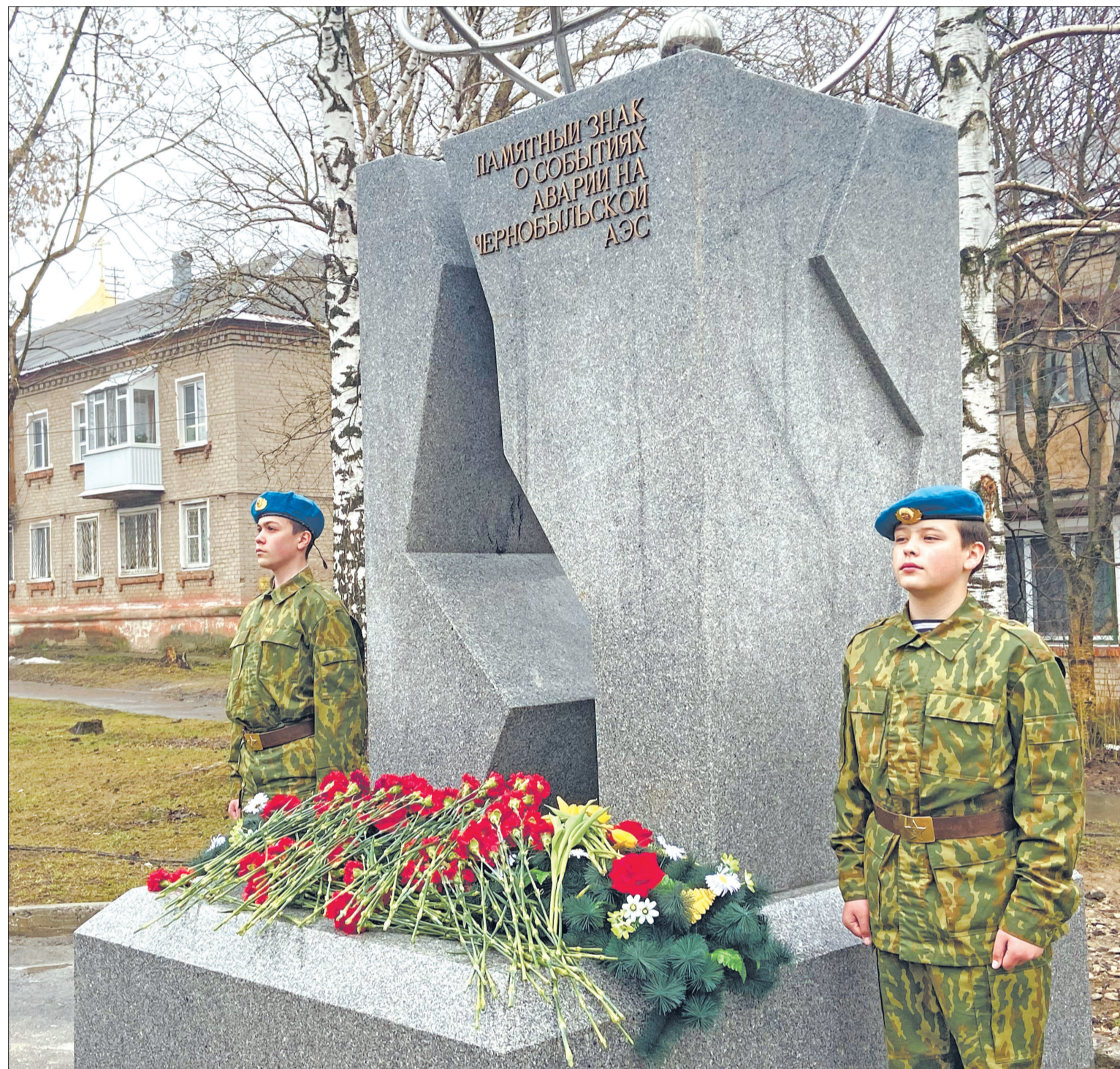
Памятник символизирует образ разрушенного энергоблока Чернобыльской атомной станции.

Мы вместе. По всей России с 23 апреля по 1 мая проходит фестиваль дарения #МЫВМЕСТЕ. 1 мая в городском парке будет организована мобильная точка здоровья, где волонтеры-медики проведут гостям парка краткий чек-ап здоровья и дадут советы по ведению здорового образа жизни. Если и вы чувствуете желание сделать что-то доброе и полезное этой весной, присоединяйтесь и проходите регистрацию на портале dobro.ru.