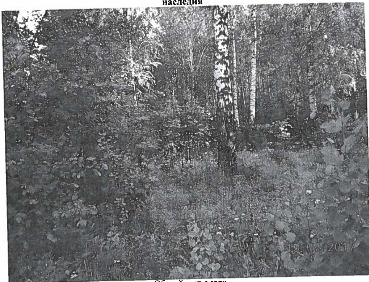
Общий вид с юга