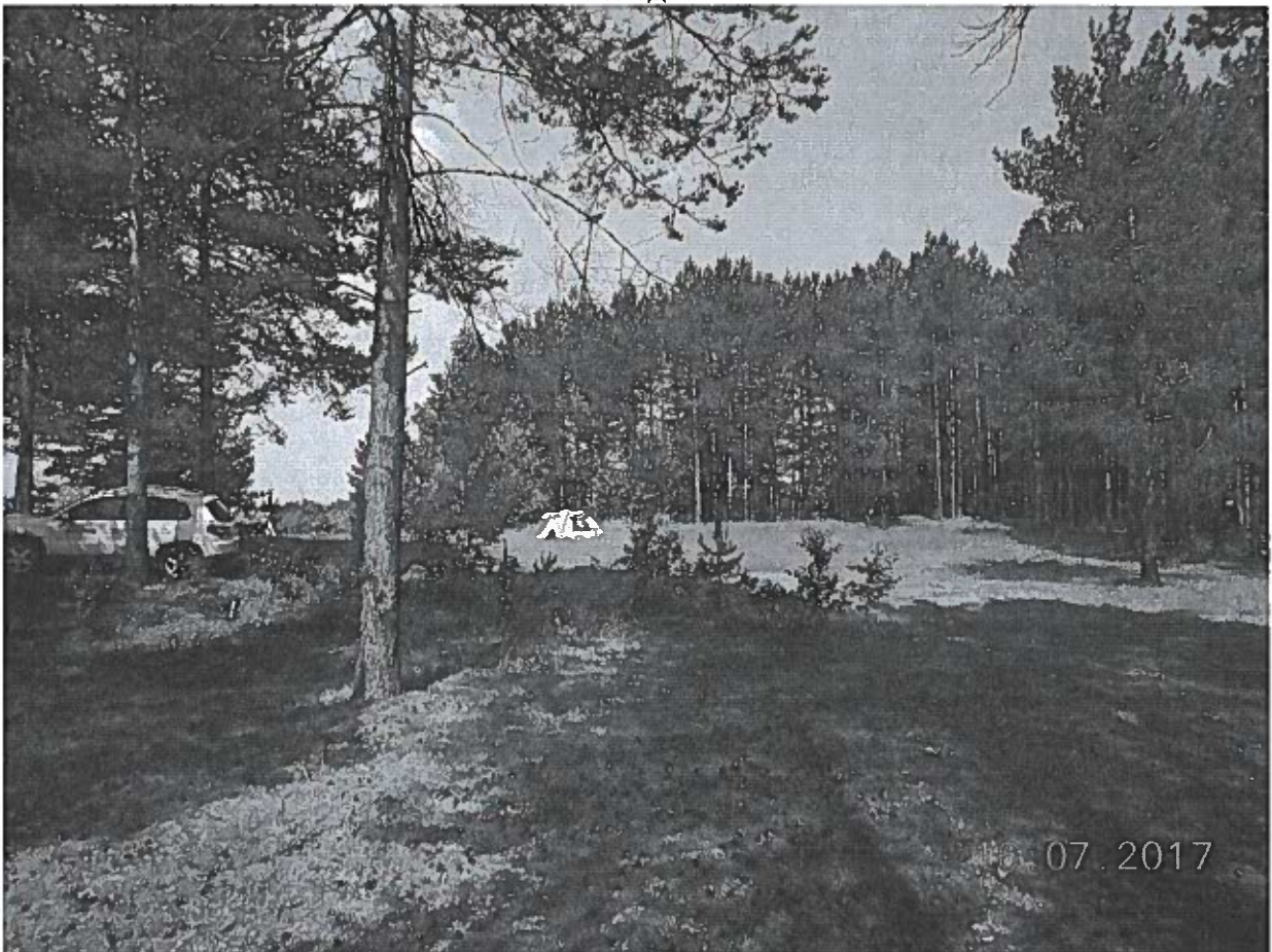
Общий вид с юго-востока