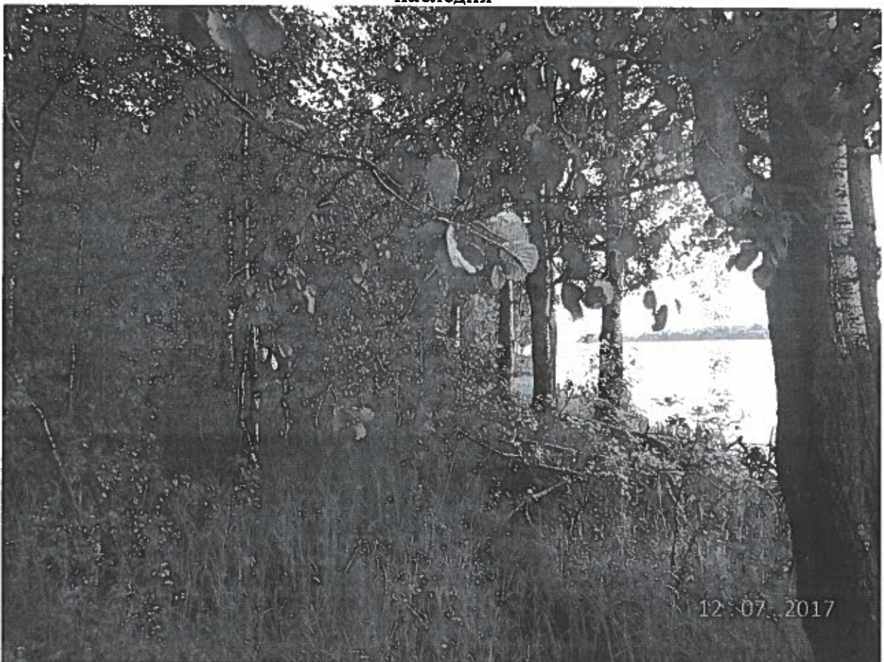
Общий вид с севера