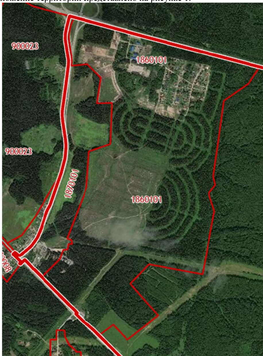
Рис.1 Местоположение территории проектирования

Местоположение территории представлено на рисунке 1.