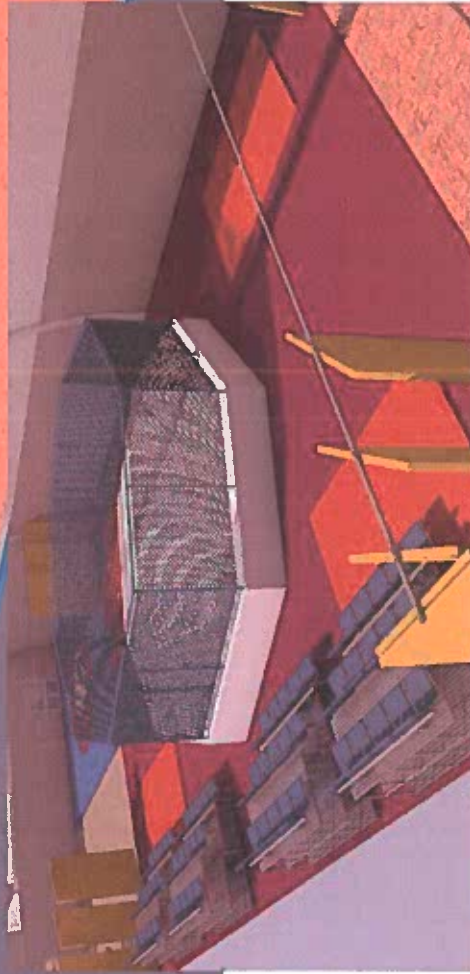
зал тренировок ММА ОКТАГОН сладкие зрительские сиденья