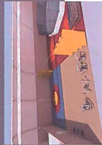
борцовский и тренажерный зал