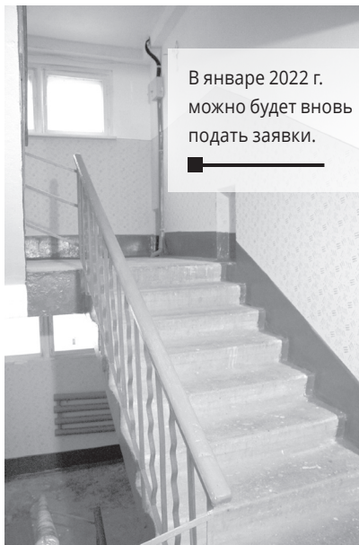
В январе 2022 г. можно будет вновь подать заявки.

Заявки могут подавать как организации, которым ранее было отказано в предоставлении субсидии, так и организации, ранее не подававшие. Кроме того, в течение 2022 г. заявочную кампанию планируется провести дважды. В