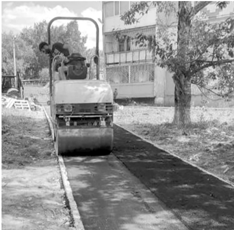
НАЦИОНАЛЬНЫЕ ПРОЕКТЫ РОССИИ ЖИЛЬЕ И ГОРОДСКАЯ СРЕДА

В БЕРЕЗНИКАХ В ЭТОМ ГОДУ СДАНЫ 12 ДВОРОВ, ОТРЕМОНТИРОВАННЫХ ПО МУНИЦИПАЛЬНОЙ ПРОГРАММЕ «ФОРМИРОВАНИЕ СОВРЕМЕННОЙ ГОРОДСКОЙ СРЕДЫ».