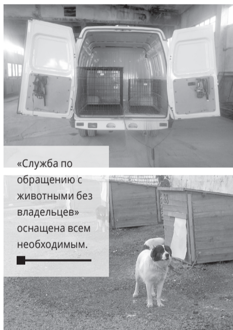
«Служба по обращению с животными без владельцев» оснащена всем необходимым.