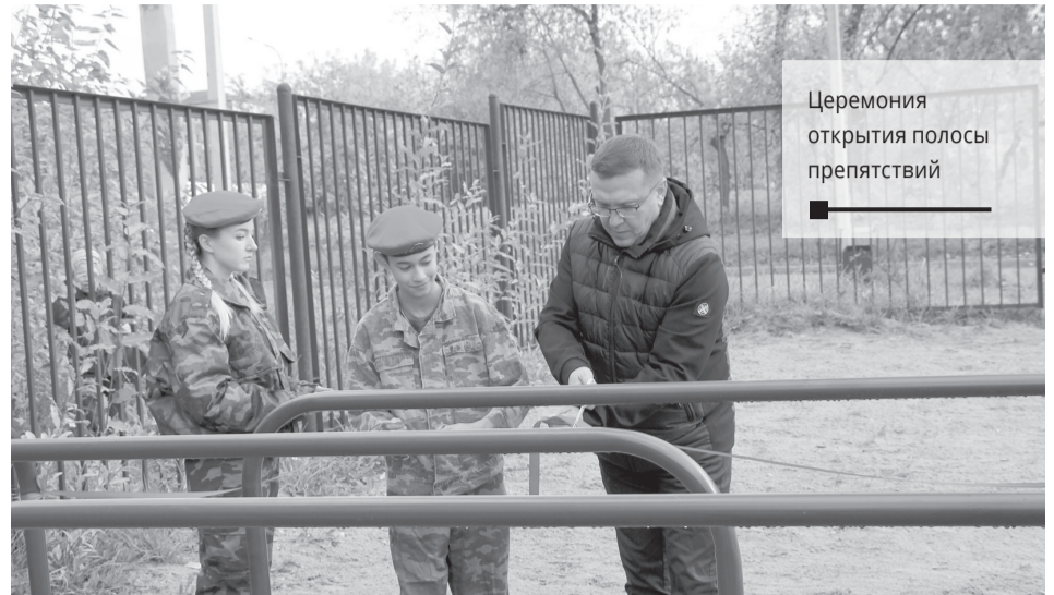
Церемония открытия полосы препятствий

В этом году при личной поддержке главы города из муниципального бюджета на реализацию данного про-