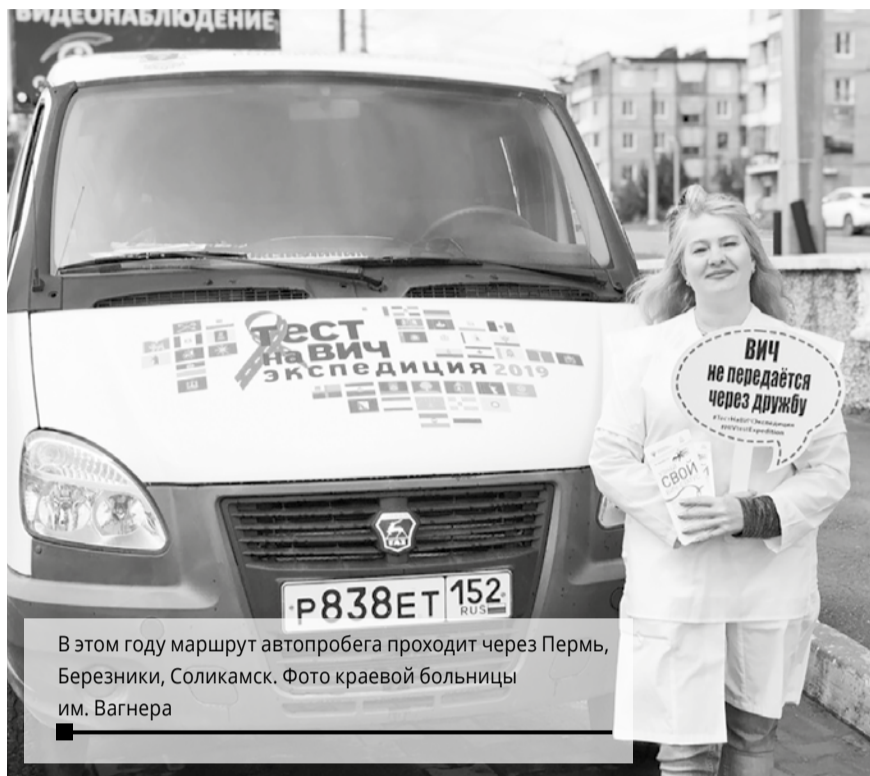
В этом году маршрут автопробега проходит через Пермь, Березники, Соликамск. Фото краевой больницы им. Вагнера

30 АВГУСТА В БЕРЕЗНИКАХ ПРОЙДЁТ БЕСПЛАТНОЕ ЭКСПРЕСС-ТЕСТИРОВАНИЕ НА ВИЧ-ИНФЕКЦИЮ.