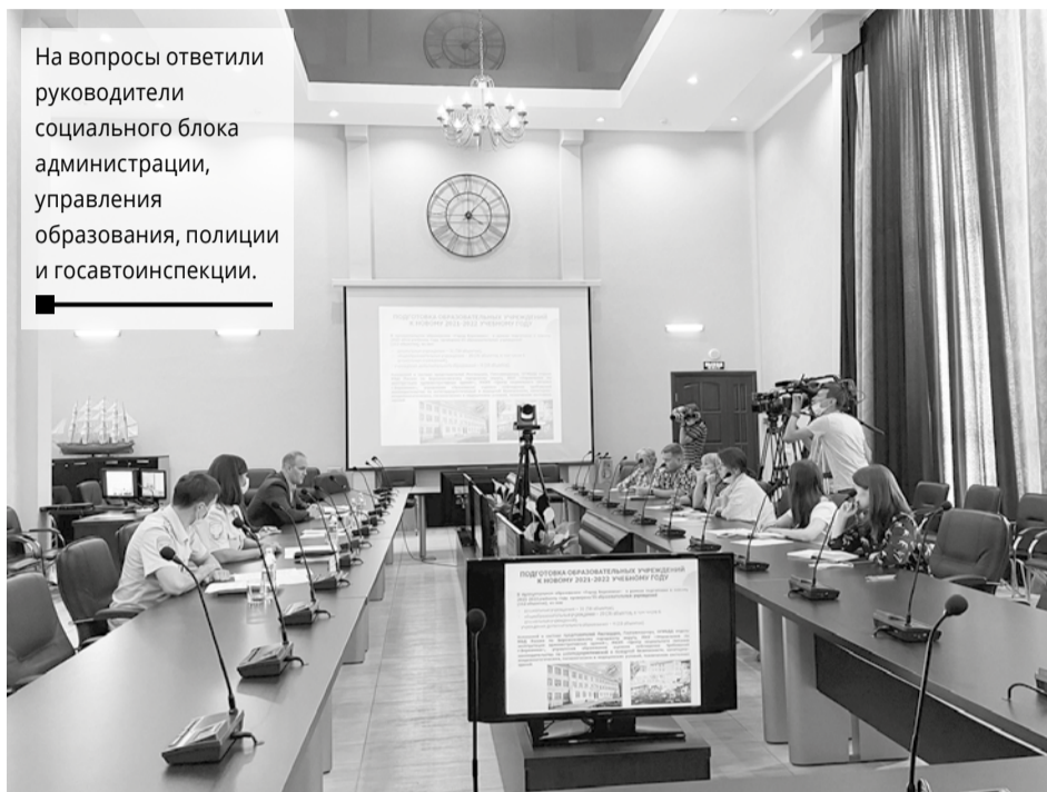
На вопросы ответили руководители социального блока администрации, управления образования, полиции и госавтоинспекции.

Закуплены ручные металлоискатели, бесконтактные термометры, средства дезинфекции и обработки помещений. Для сотрудников проходят инструктажи по технике безопасности, правилам поведения и эвакуации в случае возникновения угрозы жизни, в том числе при те-