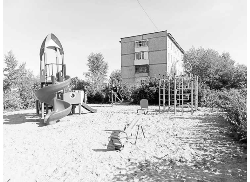
Во дворе на Парижской Коммуны появились благоустроенная парковка и детская площадка.

Подрядчик – ООО «Универсальное дорожное строительство» – выполнил работы по укладке асфальтобетонного покрытия тротуаров и гостевой парковки, а также устройство элементов детской игровой площадки.