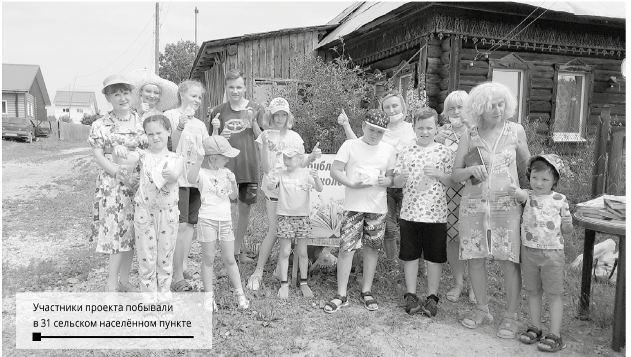
Участники проекта побывали в 31 сельском населённом пункте

ЦЕНТРАЛИЗОВАННАЯ БИБЛИОТЕЧНАЯ СИСТЕМА ГОРОДА БЕРЕЗНИКИ РЕАЛИЗУЕТ В ЛЕТНИЙ И ОСЕННИЙ ПЕРИОД 2021 ГОДА ИНТЕРЕСНЫЙ И ОЧЕНЬ ДОЛГОЖДАННЫЙ СОЦИАЛЬНО-КУЛЬТУРНЫЙ ПРОЕКТ «БИБЛИОТЕКА НА КОЛЁСАХ».