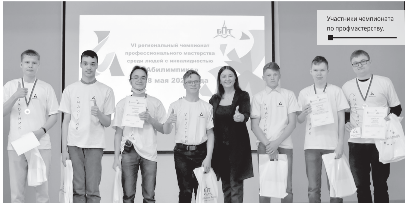
Участники чемпионата по профмастерству.

Заккрытие и награждение победителей и призёров VI регионального чемпионата прошло на базе Березниковского политехнического техникума.