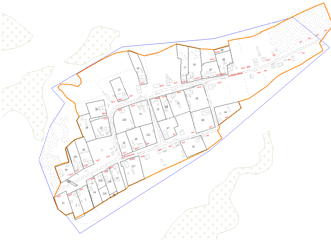
Рис.2 Местоположение территории проектирования

Площадь территории в утвержденных границах проектирования составляет 140508 кв.м. (14,05 га).