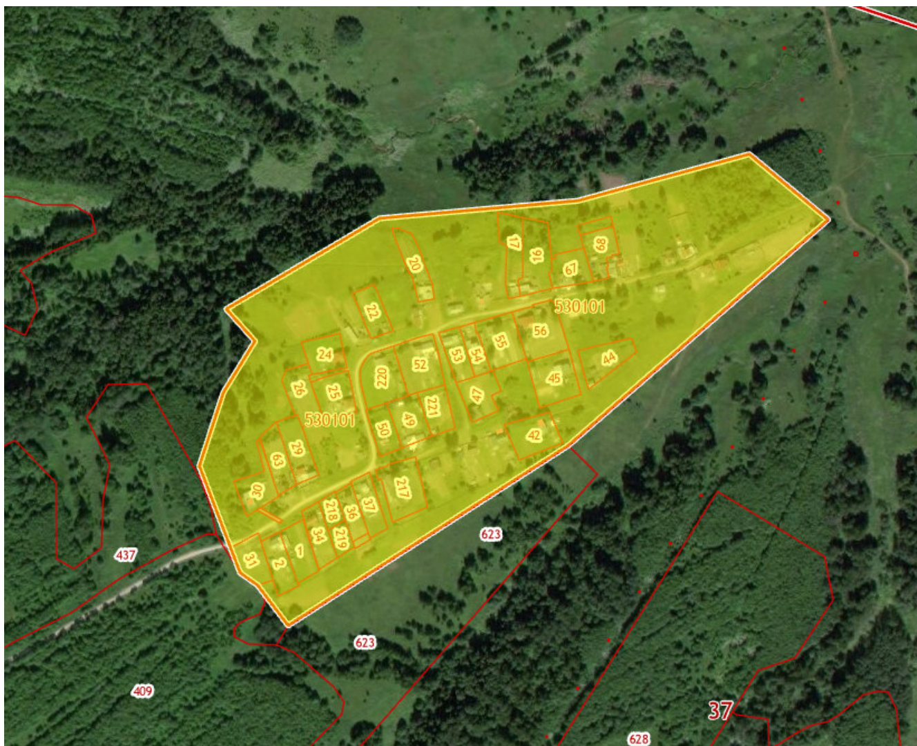
Рис.1 Местоположение территории кадастрового квартала

Разработка проекта межевания территории осуществляется в отношении кадастрового квартала 59:37:0530101, расположенного в границах населенного пункта д.Шварева Березниковского городского округа Пермского края. Территория проектирования имеет вытянутую форму, ориентированную в направлении северо-восток и юго-запад. Границы кадастрового квартала совмещены с границами населенного пункта. Местоположение территории кадастрового квартала представлено на рисунке 1. Местоположение территории проектирования представлено на рисунке 2.