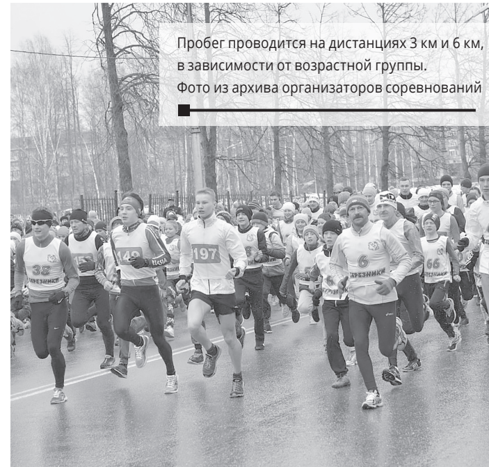
Пробег проводится на дистанциях 3 км и 6 км, в зависимости от возрастной группы.