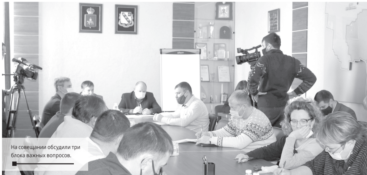
На совещании обсудили три блока важных вопросов.

УЧАСТНИКИ РАБОЧЕГО СОВЕЩАНИЯ, ПОСВЯЩЁННОГО ПОДГОТОВКЕ К НОВОМУ ОТОПИТЕЛЬНОМУ СЕЗОНУ 2021-22, ОБСУДИЛИ РЯД ВАЖНЫХ ВОПРОСОВ.