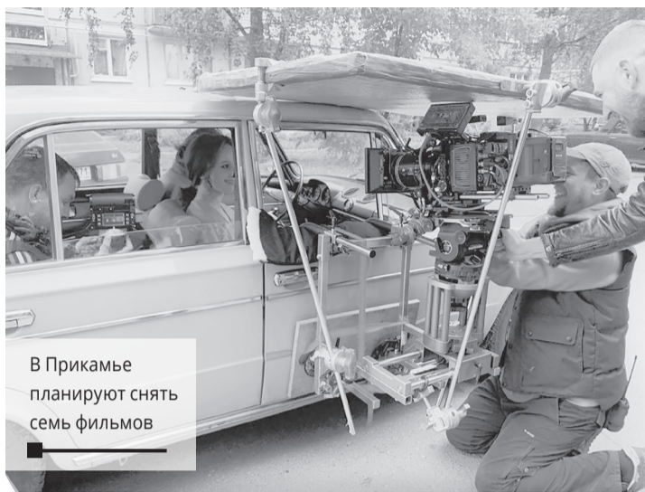
В Прикамье планируют снять семь фильмов

Ещё один фильм – приключенческая история на основе одноименного произведения Аркадия Гайдара «Чук и Гек». Режиссёр-постановщик – Александр Котт. Братья с мамой приезжают к отцу в посёлок геологов в тайге, чтобы вместе встретить новый 1939 год. Дорога приготовила им мас-