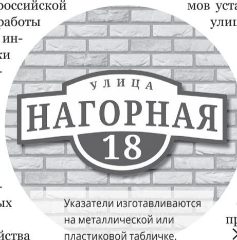
Указатели изготавливаются на металлической или пластиковой табличке.

Указатели изготавливаются на металлической или пластиковой табличке. Основа синего цвета стандарта R-(0), G-(20), B-(120), слово «улица» или подобное слово «переулок» и т.д., а также наименование улицы, номер дома (здания) размещается в белом цвете шрифтом стандарта TimesNewRoman, Arial, Helvetica (Bold). Номерные знаки и указатели улиц с наступлением сумерек должны быть освещены.