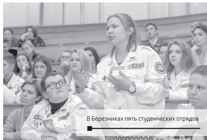
В Березниках пять студенческих отрядов