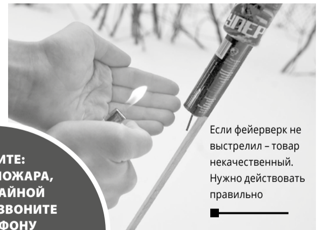
Если фейерверк не выстрелил – товар некачественный. Нужно действовать правильно

> после, подойдя к пиротехнике, допускается провести визуальный осмотр, для того чтобы удо- стовериться в том, что отсутствуют тлеющие ча- сти. Если они имеются, тогда нужно моментально отойти от пиротехники на безопасное расстояние;