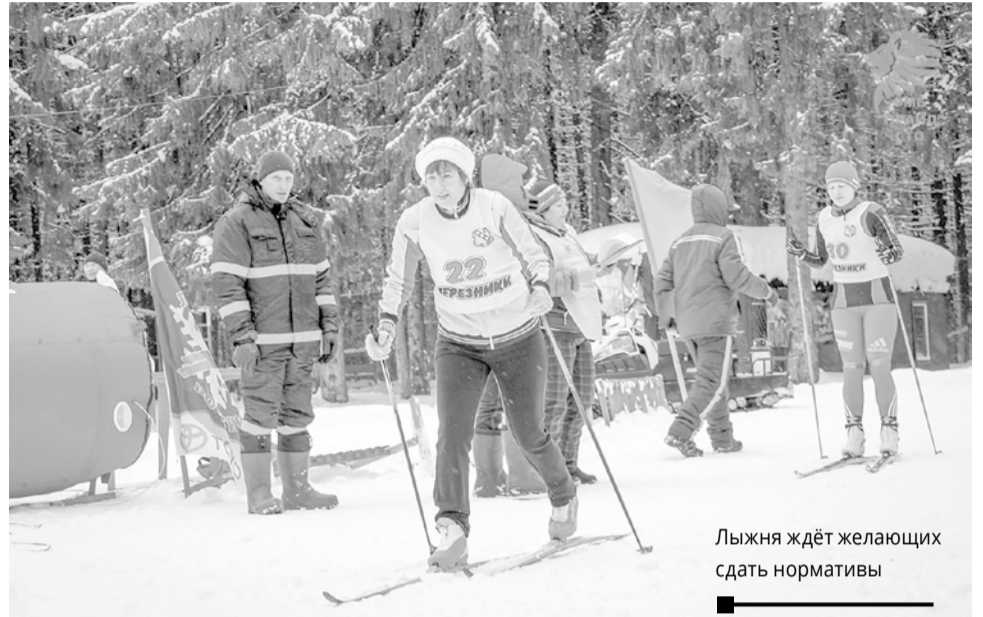
Лыжня ждёт желающих сдать нормативы

Место сдачи нормативов – спортивная школа «Темп» по адресу ул. Ломоносова, 113.