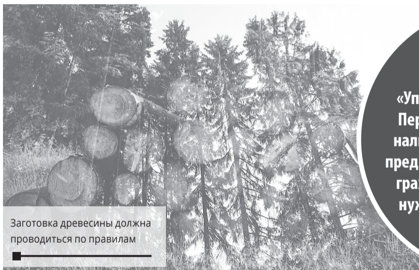
Заготовка древесины должна проводиться по правилам

Березниковское лесничество ГКУ «Управление лесничествами Пермского края» сообщает о наличии лесных насаждений, предназначенных для продажи гражданам для собственных нужд, и их местоположении в 2020-2021 году.