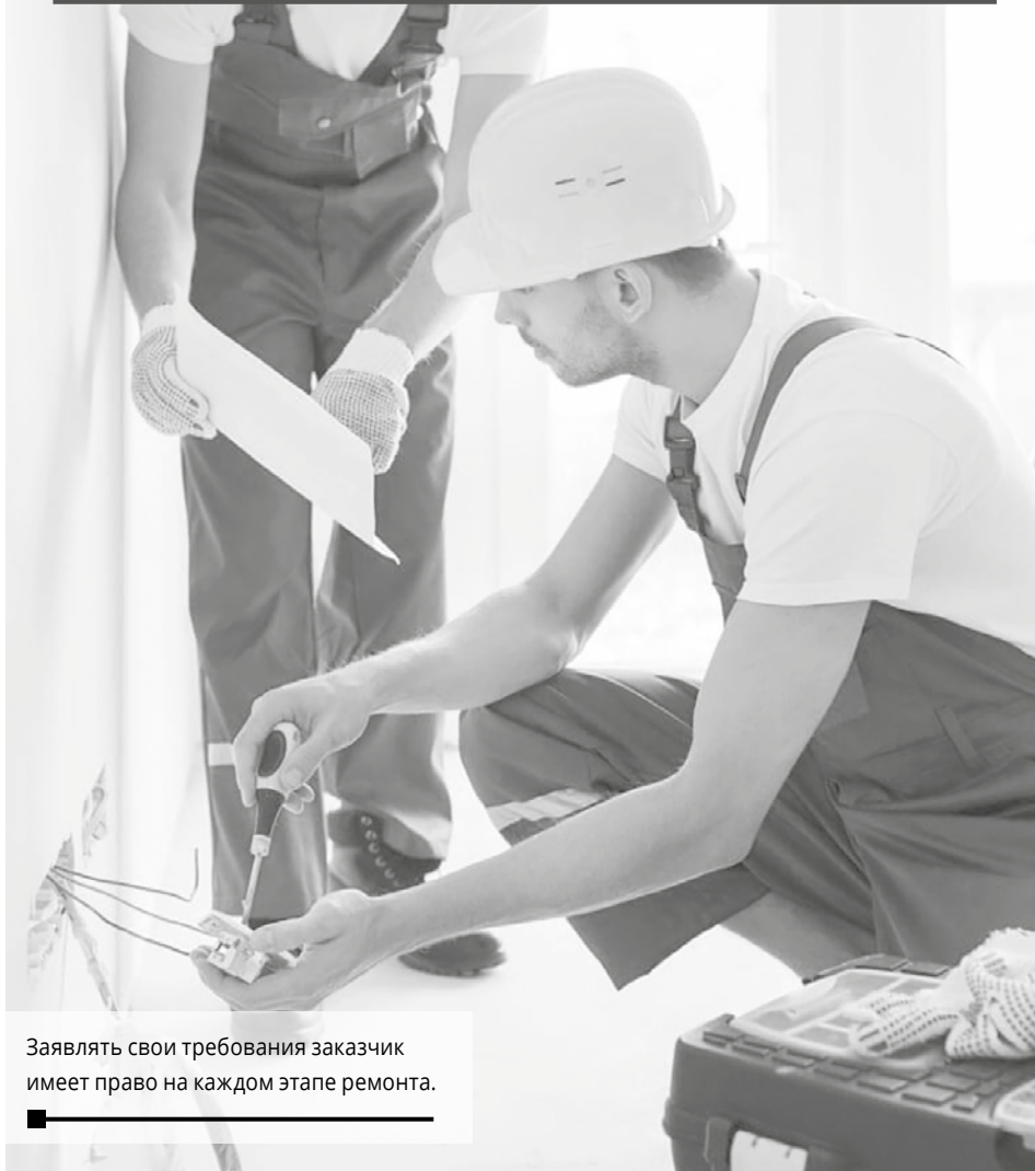
Заявлять свои требования заказчик имеет право на каждом этапе ремонта.

РЕМОНТОМ КВАРТИР, ЖИЛЫХ ПОМЕЩЕНИЙ СЕЙЧАС ЗАНИМАЕТСЯ НЕМАЛО КОМПАНИЙ, ВЫБОР ЕСТЬ. КАК НАЙТИ СРЕДИ ЭТОГО РАЗНООБРАЗИЯ ТУ ЕДИНСТВЕННУЮ, КОТОРАЯ ВЫПОЛНИТ РЕМОНТНЫЕ РАБОТЫ КАЧЕСТВЕННО И В СРОК?