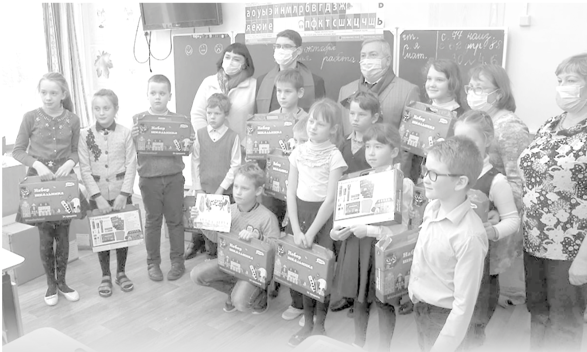
Акция «Собери ребёнка в школу» проходит в Березниках второй год