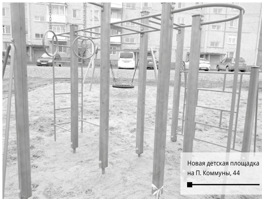
Новая детская площадка на П. Коммуны, 44

современной городской среды» является составной частью национального проекта «Жильё и городская среда». Её реализация позволит повысить комфорт качества городской среды. В Березниках сроки программы продлены до 2024 года.