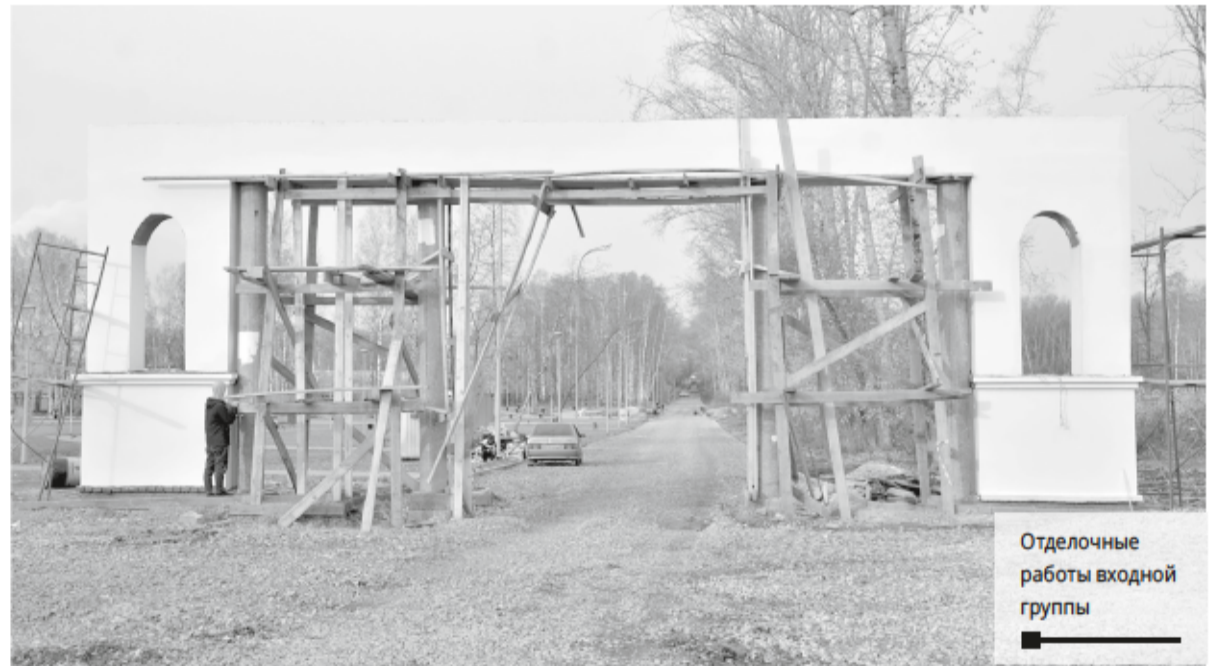
Отделочные работы входной группы

Победителей и призёров, в том числе абсолютного победителя, в номинациях «Учитель общего образования» и «Педагогический дебют» объявят на торжественной церемонии награждения участников завершающего этапа краевого конкурса «Учитель года-2020».