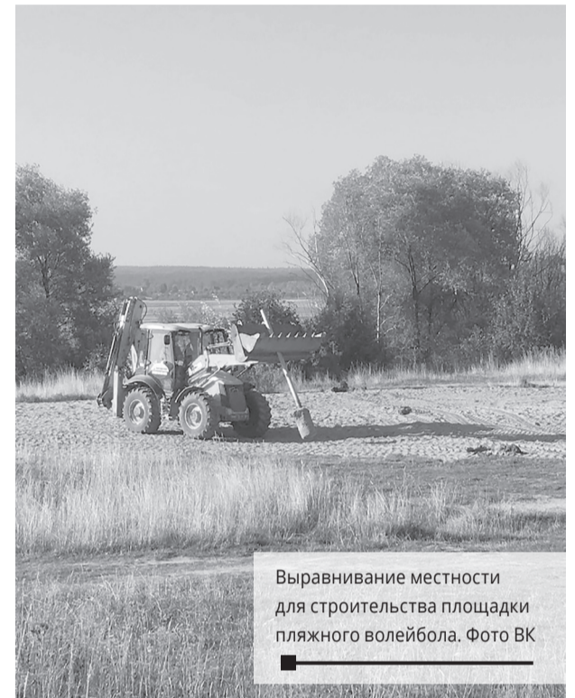
Выравнивание местности для строительства площадки пляжного волейбола.

В этом году в рамках конкурса инициативного бюджетирования на территории МО «Город Березники» реализуется пять проектов. Построена спортивная площадка на ул. Монтажников на сумму 4,8 млн руб., в Пыскоре отремонтирован Мемориальный комплекс памяти воинов, павших в Великой Отечественной войне, 1 млн руб. Три проекта в