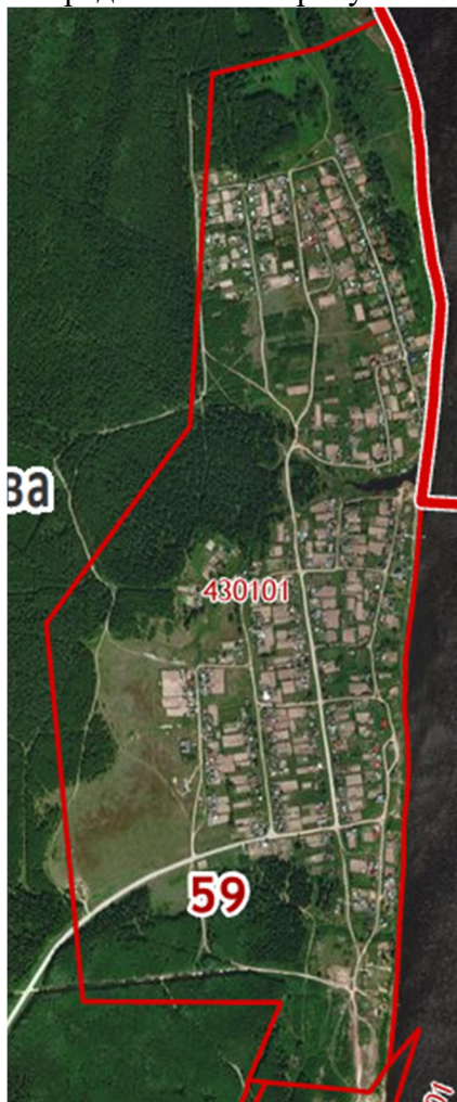
Рис.1 Местоположение территории проектирования

Местоположение территории представлено на рисунке 1.