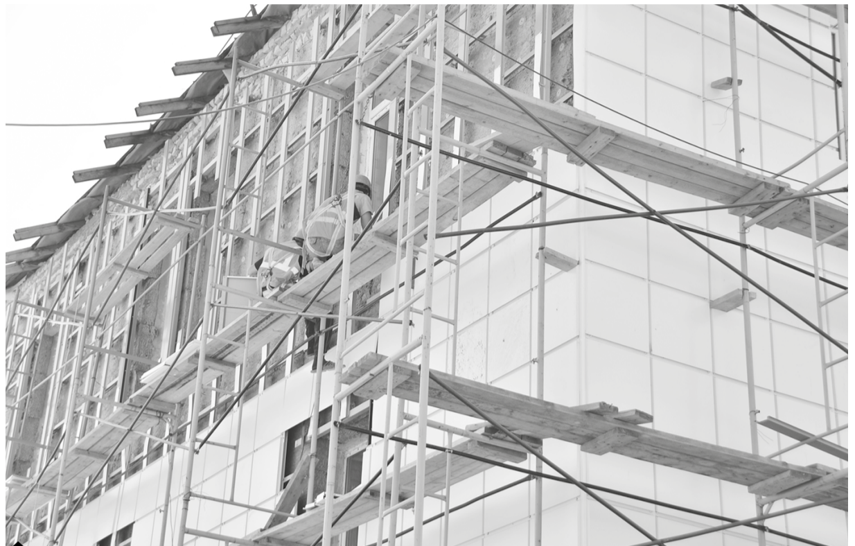
Работы по усилению фундамента здания завершены, на финальной стадии находится монтаж вентилируемого фасада. Под красно-белыми плитками – утеплитель, чтобы маленьким пациентам было тепло даже в самую суровую зиму.