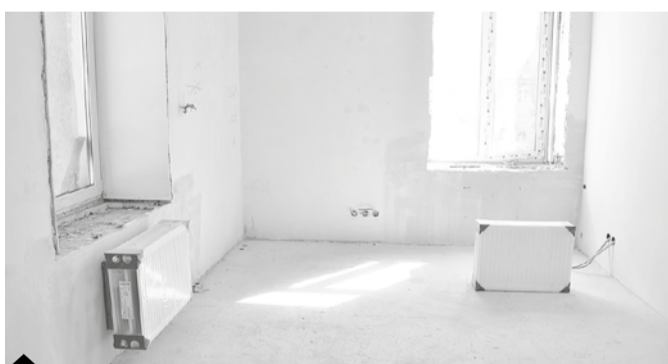
Чтобы не зависеть от плановых и аварийных общегородских работ, у детской больницы будет собственный тепловой пункт, в палатах – современные радиаторы отопления.