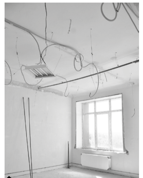
К помещению будущей операционной уже подведены мощные электрические кабели – для освещения и сложного современного оборудования, которое здесь будет установлено в следующем году.