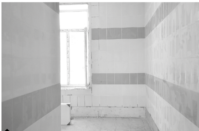
По-детски яркая плитка разбавляет стерильную больничную белизну.