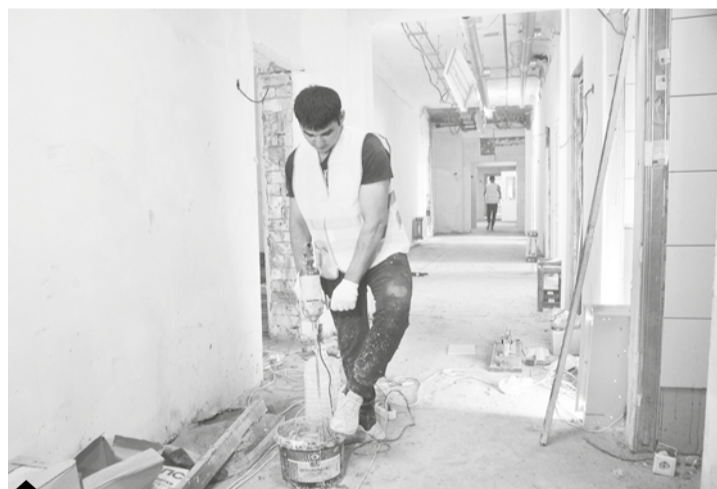
На всех трёх этажах сделана перепланировка помещений в соответствии с новыми законодательными нормами, а также с учётом особенностей здания – ряд его конструкций требовал усиления. Сейчас строители занимаются внутренней отделкой здания.