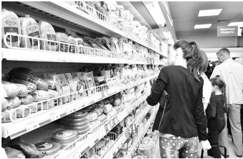
Покупатель может рассчитывать на продажу товара по стоимости, которая указана на ценнике в торговом зале.

ного макета и цветовой гаммы, кратко и полно отражать информацию о товаре, отпечатан или написан от руки разборчиво. Отказ из-за того, что сотрудники не успели поменять ценник по какой-либо причине, не может рассматриваться как веский. Если покупатель заметил, что ему проббили товар с другим ценником, то он может рассчитывать: