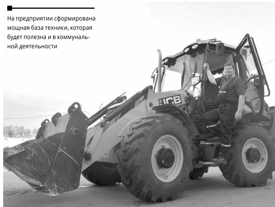
На предприятии сформирована мощная база техники, которая будет полезна и в коммунальной деятельности