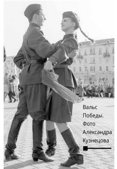
Вальс Победы.

По результатам акции «Вальс Победы» будет смонтирован общий видеоролик, куда войдут лучшие материалы участников флэшмоба со всего Пермского края. Ролик будет опубликован 9 мая на официальном сайте акции pobeda59.ru/vals-pobedy/