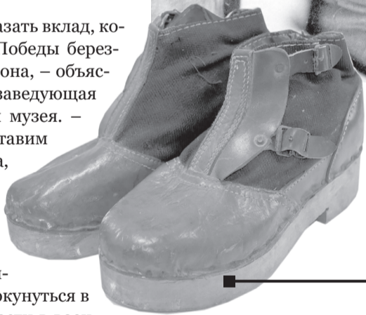
В годы войны носили ботинки на деревянной подошве

«...Деревянную обувь я не забуду: обыкновенные ботинки брезентовые зашнуровывались и на деревянной подошве. Как на платформе, сантиметров пять высотой. А по асфальту надо ходить, шлёпать. (...) В ботинках на деревянной подошве работали на складе и в цехе. По лесенкам я в них не бегала, я из дома калоши принесла. В них и ходила по лесенкам. В деревянных, особенно когда намокнут, опасно, скользко. Мама всё спрашивала, когда же эти ботинки заменят. Я отвечала: «Ничего. Раз обещают скоро фабрику пустить, и нам потом всё заменят».