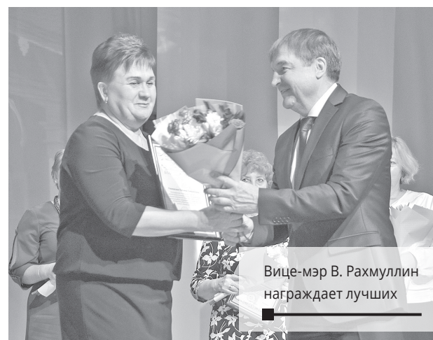
Вице-мэр В. Рахмуллин награждает лучших

Уже полностью погрузившиеся в театральный мир виновники торжества – педагоги детских садов и школ, учреждений дополнительного образования, ветераны педагогического труда – проходили в зал.