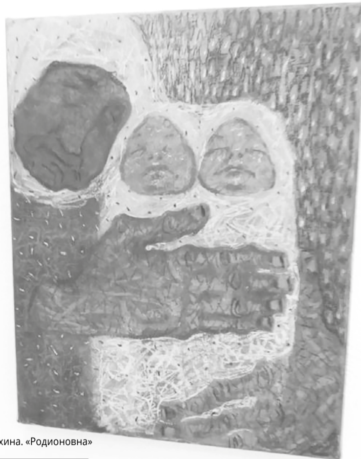
Т. Нечехина. «Родионова»

Новая выставка Татьяны Нечехиной – глубоко личные высказывания, в которых их автор видит для себя абсолютный внутренний смысл. Благодаря своему мастерству и духовной наполненности она оказывается способной передать нам эти знания.