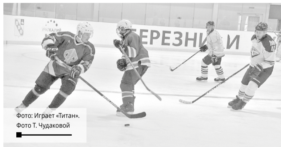
Фото: Играет «Титан».

Спортивная школа «Кристалл» объявляет о наборе детей 2012-2016 г.р. в секцию хоккея. Занятия проводят квалифицированные тренеры. Обучение платное.