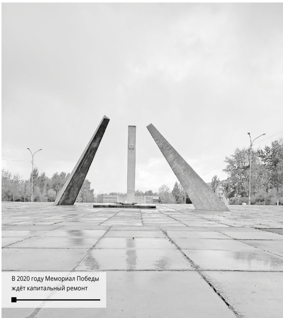
В 2020 году Мемориал Победы ждёт капитальный ремонт

У ВАС ЕСТЬ ВОПРОСЫ? ЗАДАВАЙТЕ ИХ ПО E-MAIL: 2VEREGAKAMA@MAIL.RU ЛИБО ПО ТЕЛЕФОНУ 8-912-988-77-48, ИЛИ В НАШЕЙ ГРУППЕ «БЕРЕЗНИКИ ОФИЦИАЛЬНЫЕ» В «ВКОНТАКТЕ» HTTPS://VK.COM/BRZ_OFFICIAL