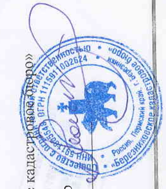
Схема изготовлена: ООО «Березниковское кадастровое агентство»