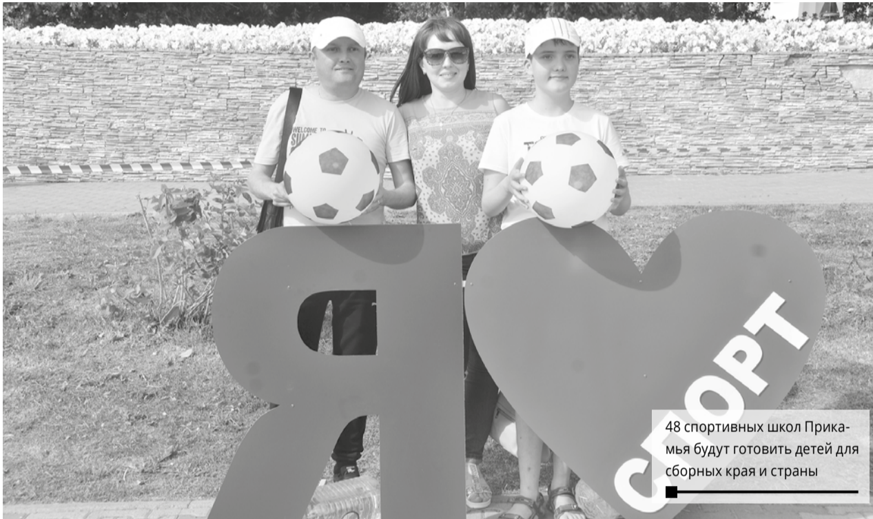
48 спортивных школ Прикамья будут готовить детей для сборных края и страны

ВО ВТОРНИК, 25 ИЮНЯ, СОСТОЯЛСЯ СОВЕТ ГЛАВ МУНИЦИПАЛЬНЫХ ОБРАЗОВАНИЙ ПЕРМСКОГО КРАЯ. РАССКАЗЫВАЕМ О ГЛАВНЫХ РЕШЕНИЯХ.