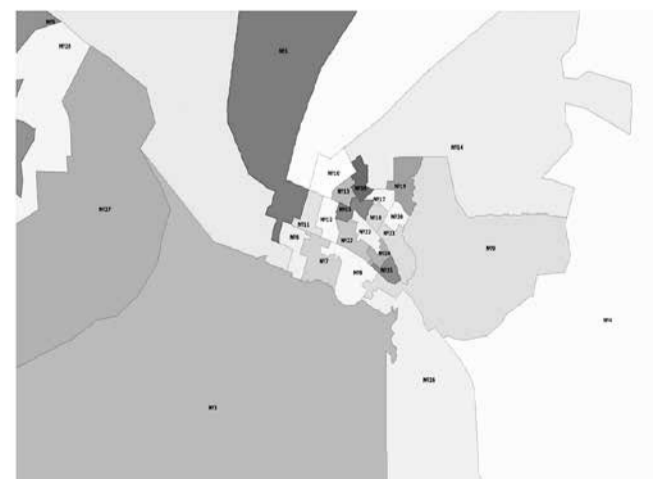
Схема одномандатных избирательных округов для проведения выборов депутатов Березниковской городской Думы

Приложение 2 к решению Березниковской городской Думы от 26.06.2019 № 610