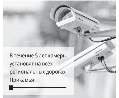
В течение 5 лет камеры установят на всех региональных дорогах Прикамья

Комментируя результаты нацпроекта, губернатор Пермского края Максим Решетников отмечал, что президент России Владимир Путин поставил задачу к 2024 г. снизить смертность в результате ДТП в 3,5 раза. По словам главы региона, этому будет способствовать установка комплексов фотовидеофиксации. В 2019 году планируется снижение количества мест концентрации дорожно-транспортных происшествий (аварийно опасных участков) на дорожной сети Пермского края до 105 (сейчас их 114).