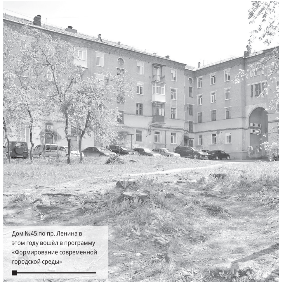
Дом №45 по пр. Ленина в этом году вошёл в программу «Формирование современной городской среды»

Исследования качества воды на бактериологические показатели выявили, что качество воды этих водоёмов соответствует требованиям