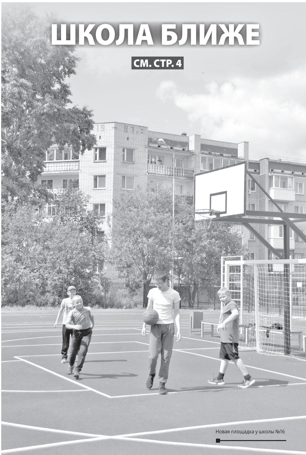
Новая площадка у школы №16