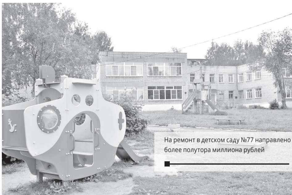
На ремонт в детском саду №77 направлено более полутора миллиона рублей