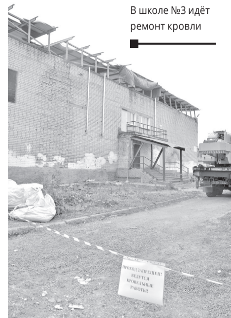
В школе №3 идёт ремонт кровли