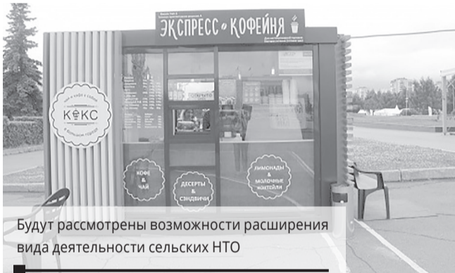
Будут рассмотрены возможности расширения вида деятельности сельских НТО

ве продавать только один вид продукции. Между тем в территории может просто не быть других мест для установки нестационарных торговых объектов (НТО), и тогда её жители, вместо того чтобы купить всё в одном месте, вынуждены в поисках нужных товаров обходить несколько магазинов.