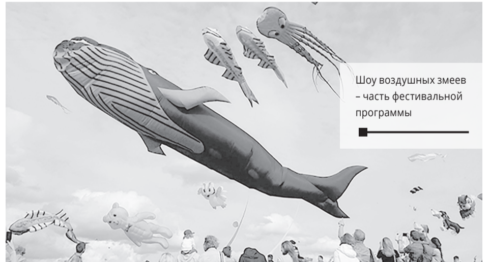
Шоу воздушных змеев – часть фестивальной программы