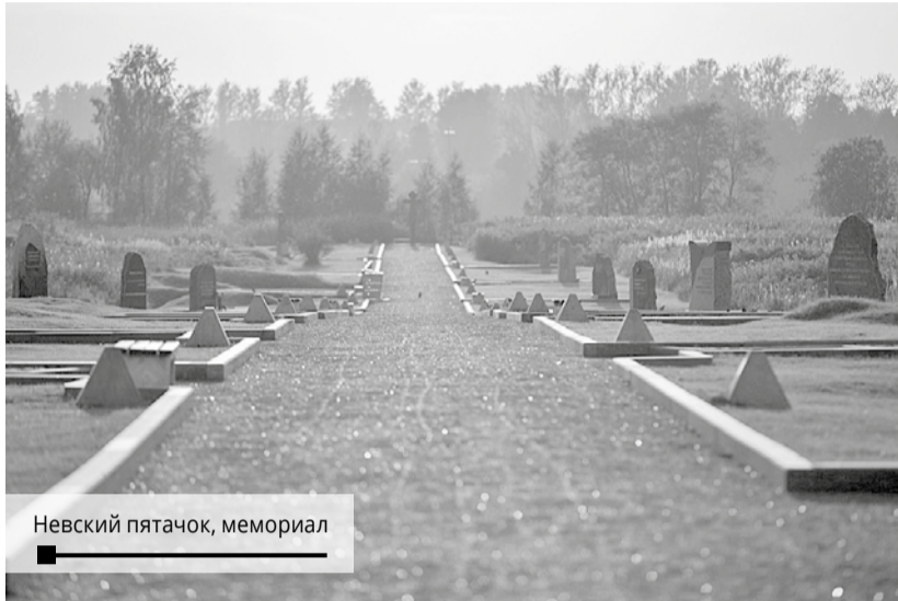
Невский пятачок, мемориал