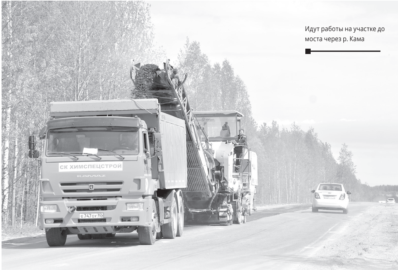
Идут работы на участке до моста через р. Кама