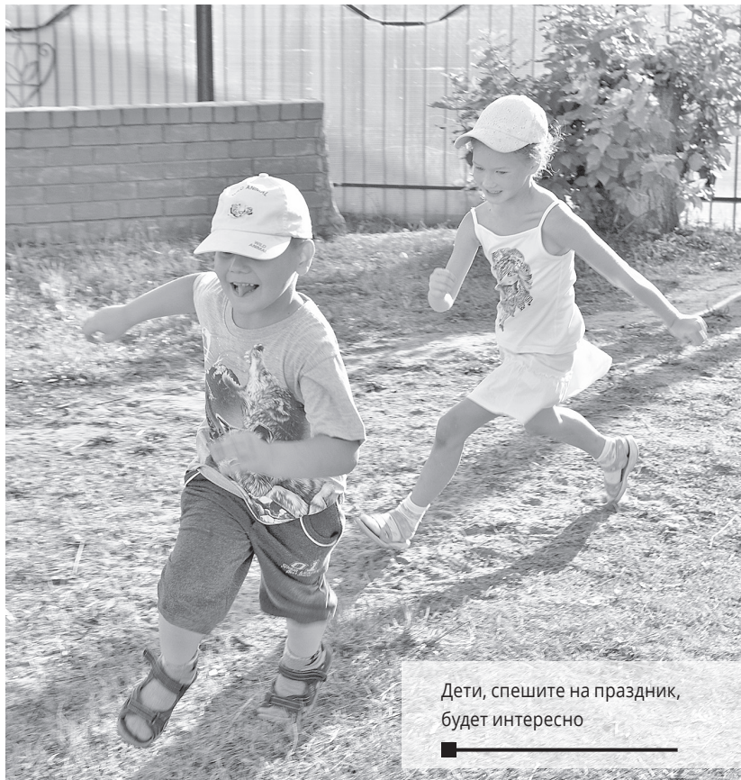
Дети, спешите на праздник, будет интересно

1 ИЮНЯ В ГОРОДСКОМ ПАРКЕ КУЛЬТУРЫ И ОТДЫХА ПРОЙДЁТ ПРАЗДНИЧНАЯ ПРОГРАММА, ПОСВЯЩЁННАЯ ДНЮ ЗАЩИТЫ ДЕТЕЙ.