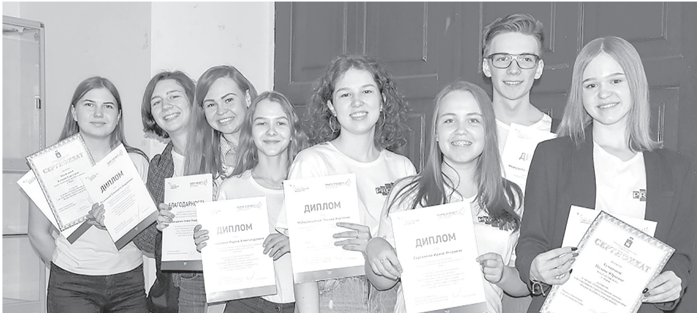
Юные жители Прикамья – участники первого сезона стратегической инициативы «Кадров будущего для регионов»

ДО 26 МАЯ МОЖНО ЗАРЕГИСТРИРОВАТЬСЯ НА УЧАСТИЕ В ПРОЕКТЕ «КАДРЫ БУДУЩЕГО ДЛЯ РЕГИОНОВ» В ПРИКАМЬЕ.