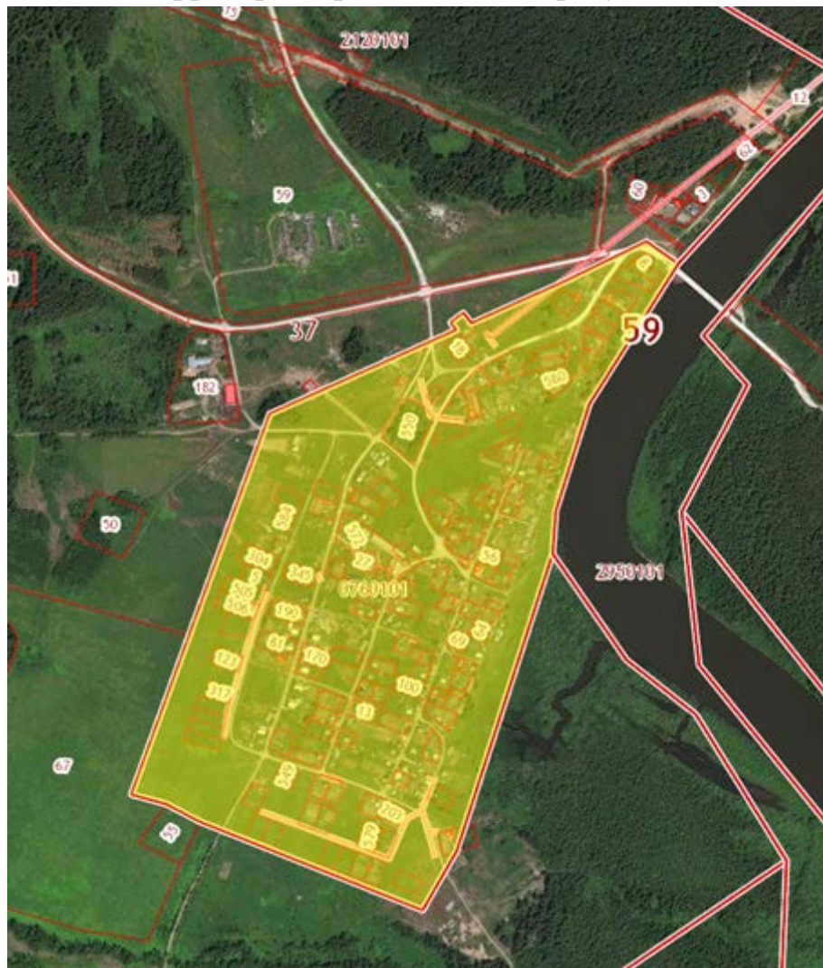
Рис.1 Местоположение территории проектирования

Местоположение территории представлено на рисунке 1.