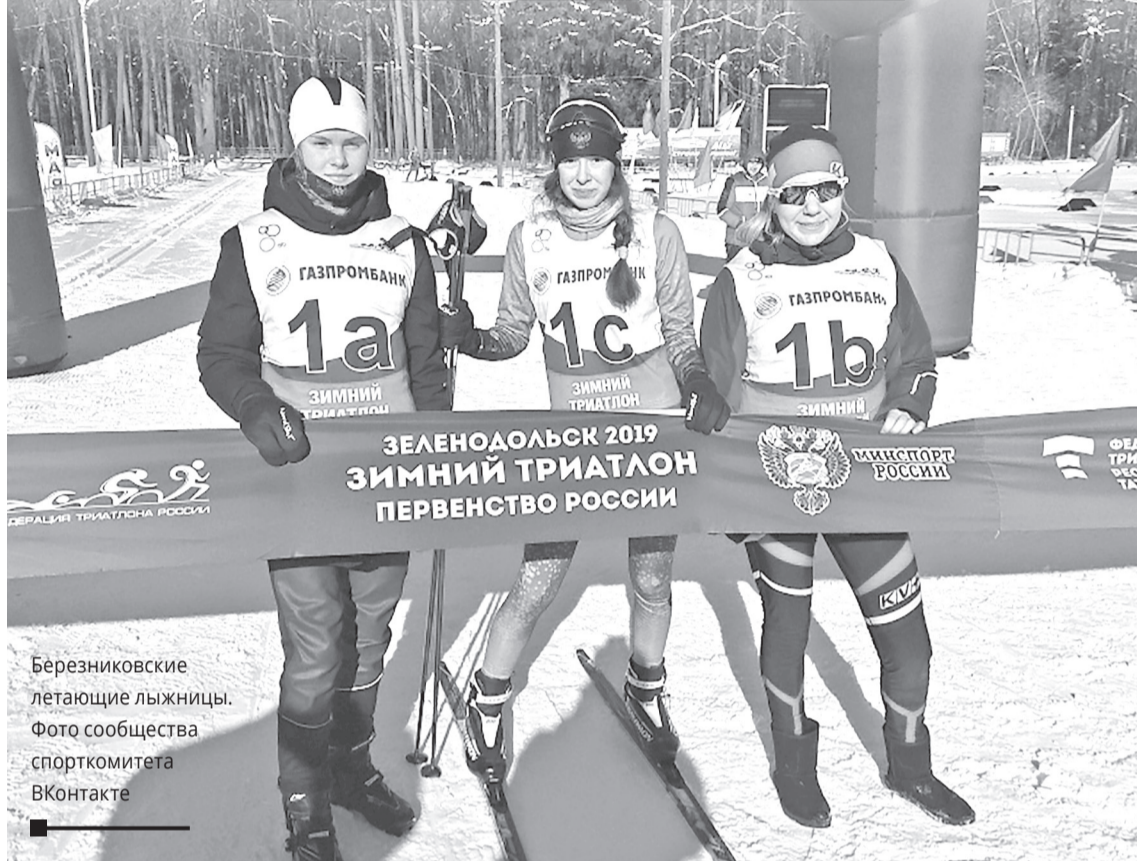
Березниковские летающие лыжницы.

БЕРЕЗНИКОВСКИЕ СПОРТСМЕНЫ ПОБЕДИЛИ В ПЕРВЕНСТВЕ РОССИИ ПО ЗИМНЕМУ ТРИАТЛОНУ (Г. ЗЕЛЕНОДОЛЬСК, 1-3 МАРТА).