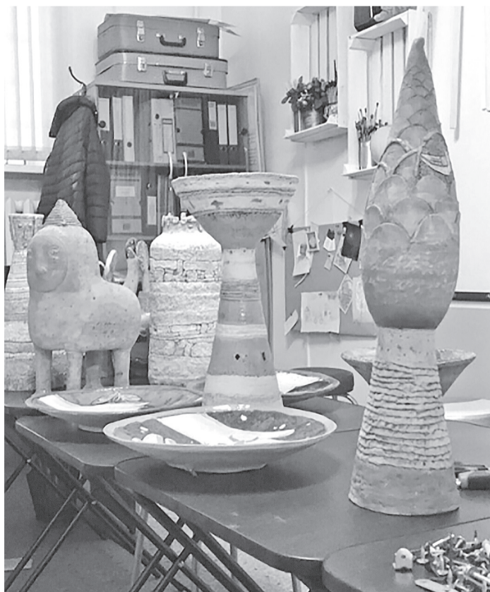
Подготовка к выставке «Параллельные миры».

9 марта в Березниковском историко-художественном музее им. И.Ф. Коновалова откроется новая выставка «Параллельные миры». Будут представлены работы 20 екатеринбургских художников, выполненные в технике ручного ткачества, росписи по ткани, художественного войлока, горячей эмали, а также авторская керамика и произведения ювелирного искусства.