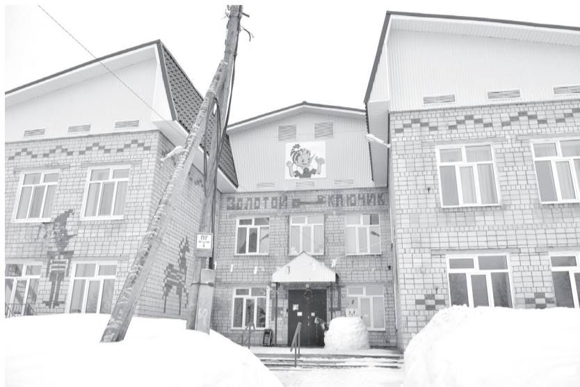
Детский сад в Пыскоре – современное учреждение образования – структурное подразделение Пысдорской средней школы. В саду четыре группы, посещают около 40 детей из Пыскора и окрестных деревень.

Таксофон есть в каждой деревне, Пыскор – не исключение, но судя по сугробу, в котором утонул аппарат, он не пользуется спросом. Со стационарной телефонной связью в Пыскоре проблем нет, с мобильной – местные тоже не видят, хотя хорошо «берёт» только один оператор сотовой связи.