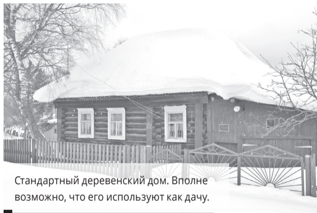
Стандартный деревенский дом. Вполне возможно, что его используют как дачу.