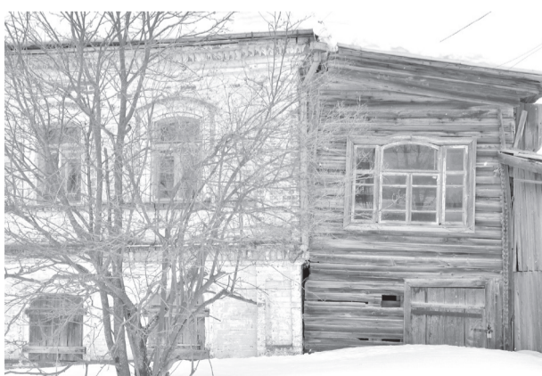
В исторической части Пыскора можно увидеть дома дореволюционной постройки. В этом доме не живут, он продаётся.