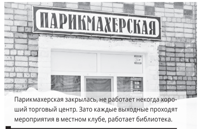
Парикмахерская закрылась, не работает некогда хороший торговый центр. Зато каждые выходные проходят мероприятия в местном клубе, работает библиотека.