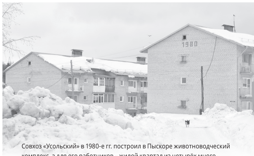
Совхоз «Усольский» в 1980-е гг. построил в Пыскоре животноводческий комплекс, а для его работников – жилой квартал из четырёх многоквартирных домов. Эти дома стоят до сих пор – кусочек города в сельской местности. Комбинат вместе с совхозом «Усольским» закрылся.