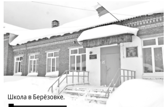
Школа в Берёзовке.