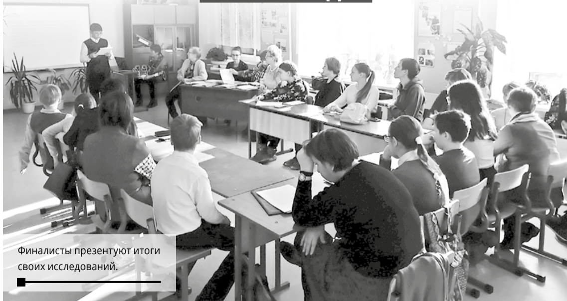
Финалисты презентуют итоги своих исследований.

Завершился муниципальный этап краевого конкурса «Чистая вода-2019» среди молодёжи. Его организаторы – управление образования администрации города, Станция юных натуралистов при поддержке управления по охране окружающей среды и природопользованию администрации города.