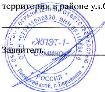
Схема расположения земельного участка или земельных участков на кадастровом плане территории в районе ул.Свердлова, дом 33. (Масштаб 1 : 1000):