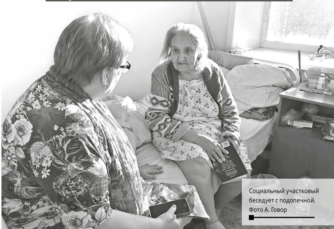
Социальный участковый беседует с подопечной.