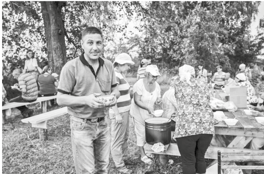
28 июля 2018 г. деревня Володин Камень отметила 395-летний юбилей. Праздник получился большой и весёлый, с богослужением, концертом, угощением, дискотеккой. В этот день в деревню приехали и те, кто здесь некогда родились и росли, и родственники тех, кто живёт в Володине Камне сегодня. Главным угощением на празднике была уха, сваренная вскладчину местными жителями. Рыбаки наловили рыбы, а картошку и лук в деревне искать не надо. Женщины сварили огромную кастрюлю ухи. Хватило всем.