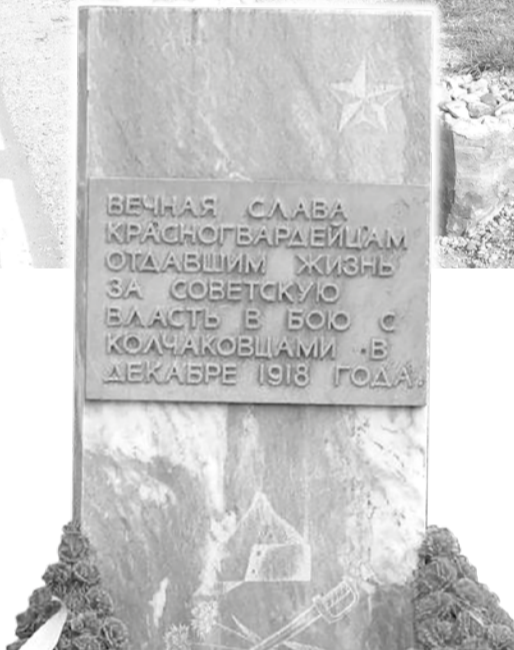
Памятник красноармейцам, воевавшим в этих краях в 1918 г.

Из коммунальных благ в Володине Камне только электричество, и то постоянно отключается – то ветер провода оборвёт, то снег, то упавшее дерево. Водопровод только летний, но жители деревни сами пробурили скважины и от него не зависят. Газа нет, отопление печное. Сотовая связь – с перебоями, не всегда можно подключить интернет. Ближайший магазин – в Романово, в деревне только киоск.