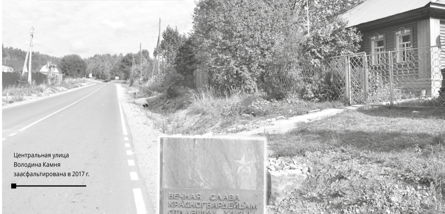
Центральная улица Володина Камня заасфальтирована в 2017 г.

ДЕРЕВНЕ ВОЛОДИН КАМЕНЬ ИСПОЛНИЛОСЬ 395 ЛЕТ.