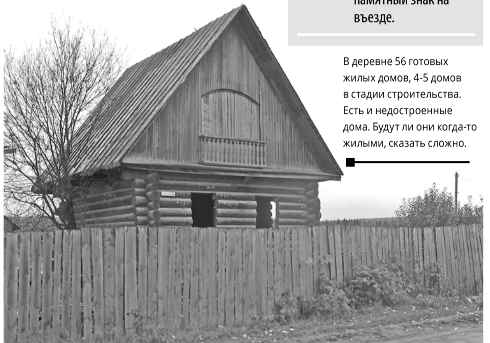
В деревне 56 готовых жилых домов, 4-5 домов в стадии строительства. Есть и недостроенные дома. Будут ли они когда-то жилыми, сказать сложно.

Жители занимаются на личных подворьях, рыбачат, охотятся.