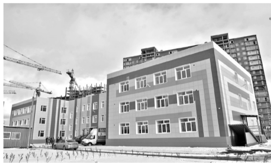
С 2019 года в новом детском саду в «Любимове» откроются первые группы

– Как я уже говорил, округ получает мощную поддержку краевого правительства. Первое – помощь в финансировании наиболее