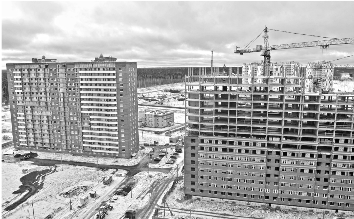
Сегодня правый берег активно застраивается

сейчас руководство березниковского водоканала устанавливает специальные модули на скважины, чтобы люди в Усолье получали воду.