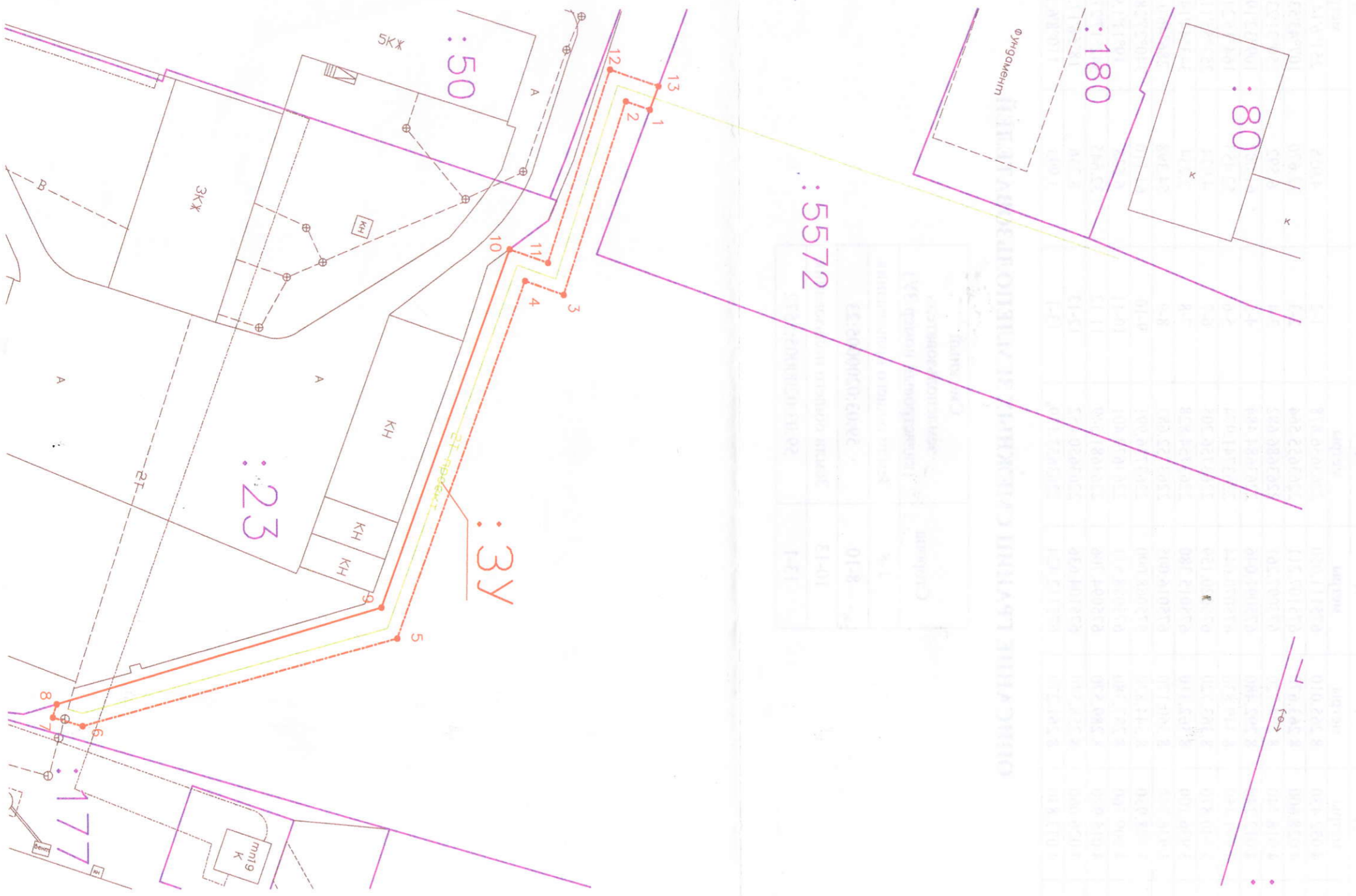
Схема изготовлена: ООО «Березниковское кадастровое бюро»

(к решению о размещении объектов на землях или земельных участках, находящихся в муниципальной собственности) Объект: Строительство сети теплоснабжения для подключения к системе теплоснабжения объекта: "Производственная база и бытовые помещения", расположенные по адресу ул. Фрунзе, 20а г. Березники Местоположение: Пермский край, город Березники, в районе улицы Фрунзе, 20а Кадастровые кварталы: 59:03:0200005 Площадь участка — 704 кв.м. Категория земель: земли населенных пунктов Вид разрешенного использования: земли общего пользования Цель использования земельного участка: строительство теплотрассы Масштаб 1:750 (в 1см 7,5 метров)